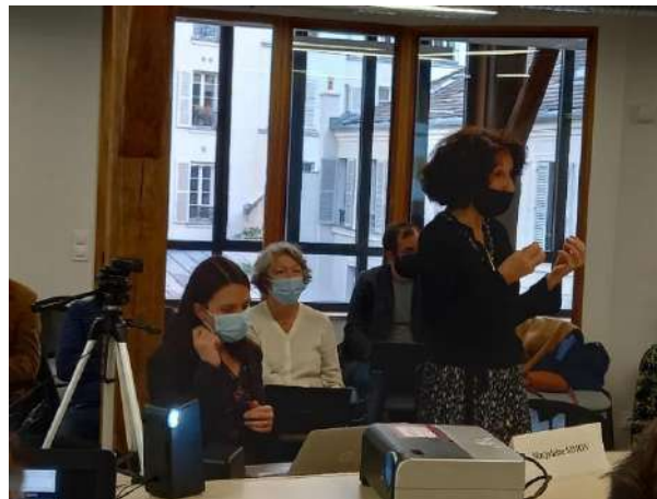
Images: Différents moments de la journée d'études à la MDR de la Sorbonne Nouvelle

La Maison de la recherche de la Sorbonne Nouvelle fût la scène de choix pour accueillir, le 2 décembre 2021 la journée d'étude consacrée au lancement de la bibliothèque numérique CLIODIFLE (BNC), première bibliothèque numérique d'archives sur l'histoire de la didactique du français langue étrangère (DFLE) et véritable pivot du projet CollEx-Persée CLIODIFLE.