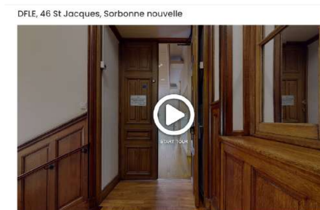
Image à gauche : fiches d'inscriptions des étudiants / Image à droite : capture d'écran de la visite virtuelle