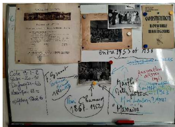
Image à gauche : salle de travail du dépouillement / Image à droite : un des tableaux de bord de la salle

A la rentrée 2020, l'équipe 1 (recherche) débute le travail de dépouillement, de description et de cotation des archives, d'extraction des métadonnées, de création des tableurs Excel ainsi que des arborescences. 1 journée par semaine est entièrement consacrée à ce travail (une moyenne de 5 à 6 heures de travail) et ce malgré les confinements successifs. CLIODIFLE a ainsi permis le