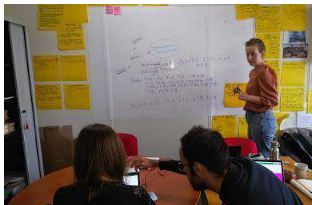
Images : différents moments de la préparation du fichier pour la numérisation