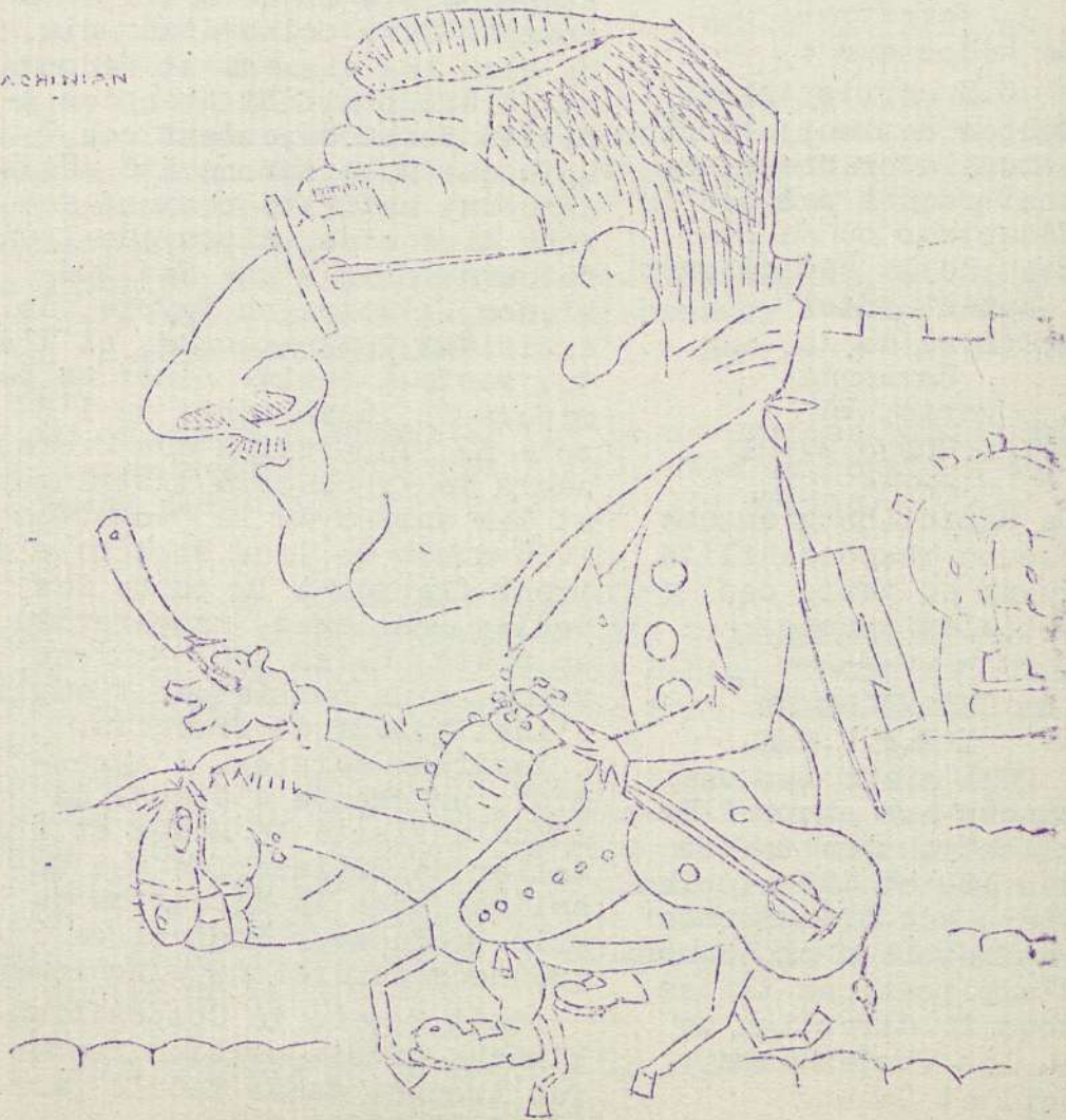
Le rasoir pédagogique n°8, G.E. Morris Allen, EPPFE-8-3-7 https://CLIODIFLE.huma-num.fr/s/CollEx-CLIODIFLE/item/513