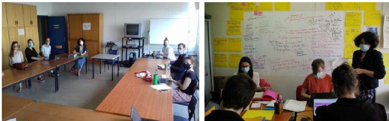
Image à gauche : réunion avec le prestataire / Image à droite : session de travail de dépouillement

Le contrat CollEx-Persée débute en septembre 2020, mais dès la constitution du dossier, fin 2019-début 2020, les deux équipes principales (1 et 2) sont constituées, très motivées. Elles se mettent au travail de manière collaborative, sans attendre le résultat du concours, qui est venu conforter, en mai 2020, à la sortie du premier confinement, leur engagement. Durant cette première période, les archives sont rassemblées sur un seul site accessible à toute l'équipe, elles sont ordonnées, les responsabilités partagées, les équipes apprennent à se connaître et se familiarisent avec les archives qu'elles découvrent.