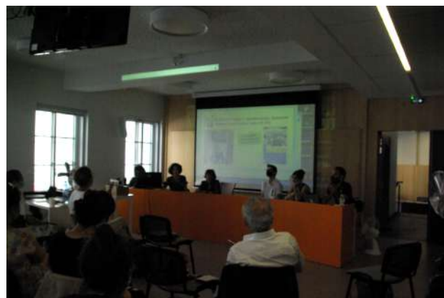
Images : Présentation de l'équipe CLIODIFLE lors de la journée du DILTEC à la MDR de la Sorbonne Nouvelle

Lors de la journée annuelle du laboratoire DILTEC, à la Maison de la recherche de la Sorbonne Nouvelle, le 15 juin 2021, l'équipe de travail du projet CLIODIFLE présente pour la première fois, à toute l'unité de recherche, ses réalisations et avancées.