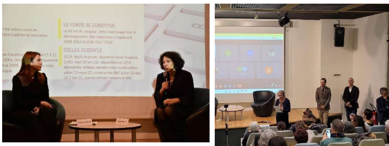
Images : Présentations lors du colloque international à l'Alliance Française

Le colloque Archives, histoire, mémoires numériques du français langue étrangère et des francophonies a eu lieu en décembre 2022, il a été l'occasion de présenter au plus grand nombre les