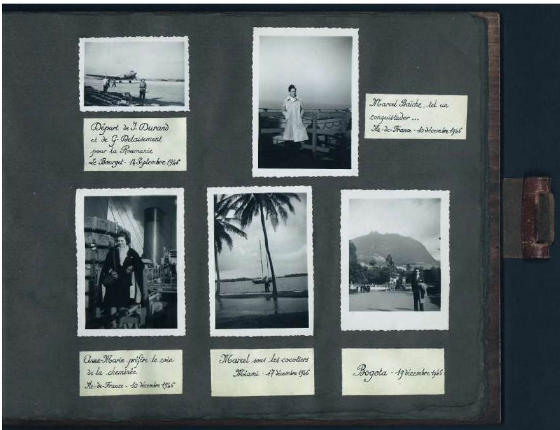
Album en bois gravé des Maringouins, 5 petites photos N&B, EPPFE-3-7-1944-1946-43 https://CLIODIFLE.huma-num.fr/s/CollEx-CLIODIFLE/item/325