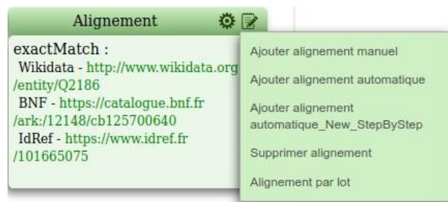
Capture d'écran des options d'alignement dans OpenTheso1

Un traitement manuel ou “semi-automatisé” est possible dans le thésaurus de Frantiq. En effet, une fois connecté·e, l'utilisateur·ice peut accéder aux fonctionnalités de traitement des alignements.